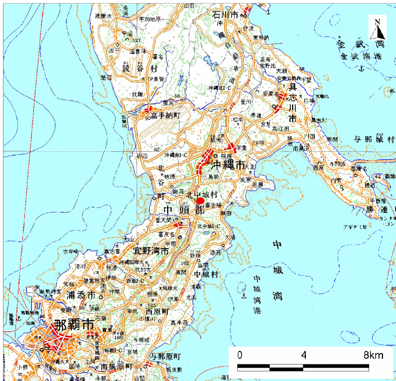
( 1/200,000 )