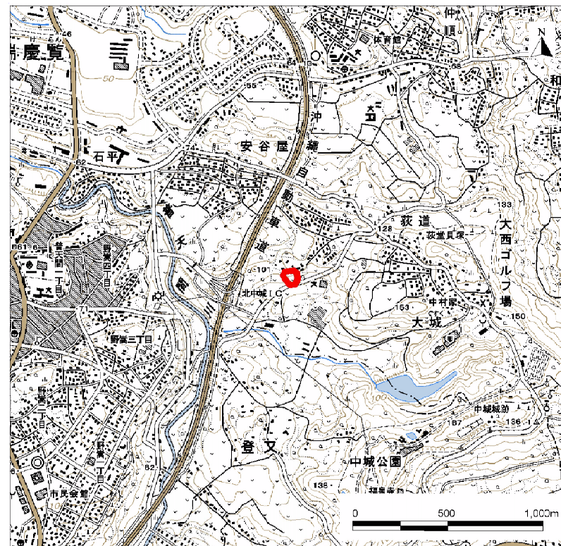
( 1/25,000 )