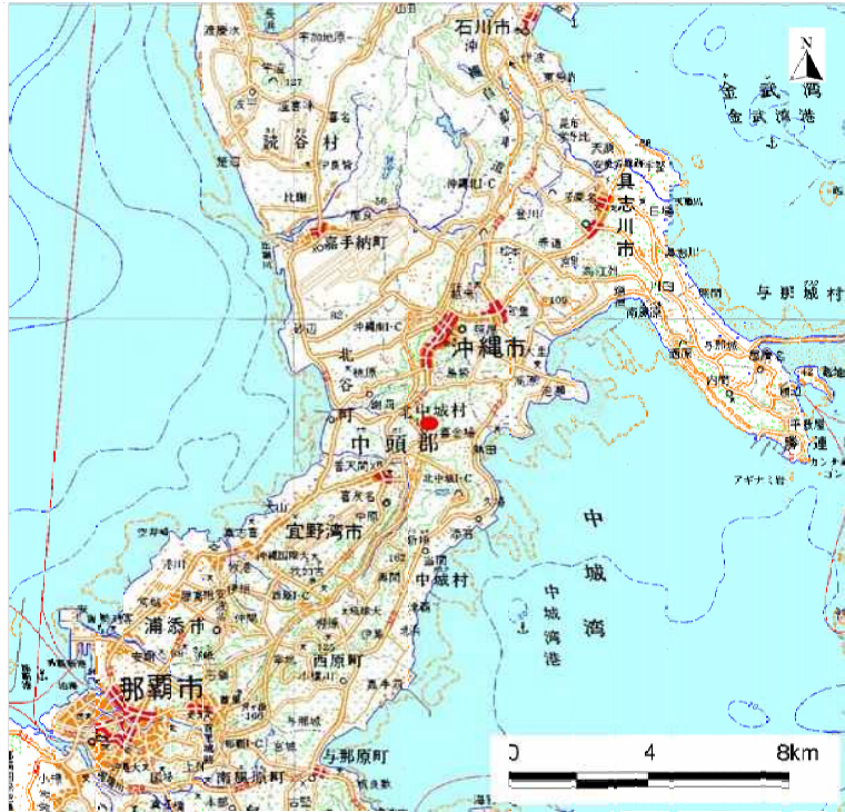
( 1/200,000 )