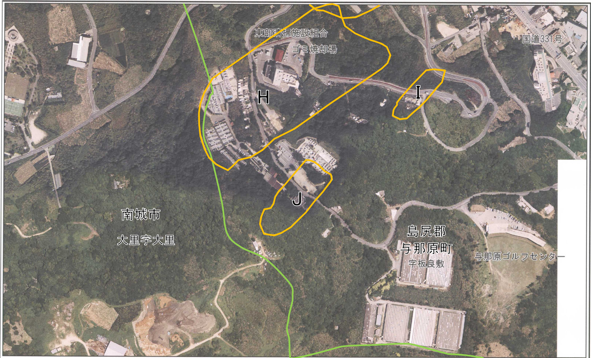
様式-2-1 (地) 土砂災害警戒区域 区域図(その2)