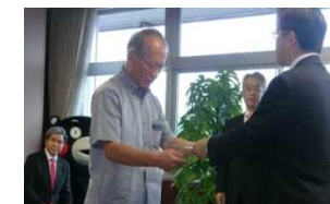
2017年7月26日 指定書交付式