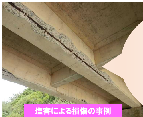
塩害による損傷の事例

黒潮、季節風、台風の影響を受け、温暖多雨の気候から、他県と比べても橋梁が錆びやすい厳しい自然環境にあります。