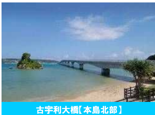
古宇利大橋【本島北部】

沖縄県は本島をはじめ、宮古島、石垣島、西表島など多くの島々から構成されています。島々を結ぶ離島架橋は、海水の塩分の影響を大きく受けることとなります。また、離島架橋以外でも、県内の多くの橋梁は、先に述べた塩害によって早く劣化する傾向にあります。