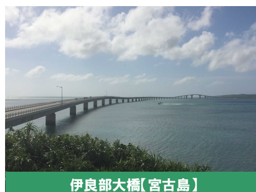
伊良部大橋【宮古島】