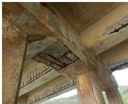
図-3 橋梁の健全度の割合 (2022年現在)