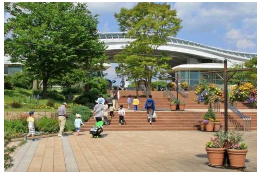
入口ゾーン 歴史公園センター