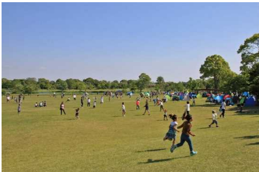
古代の原ゾーン 弥生の大野