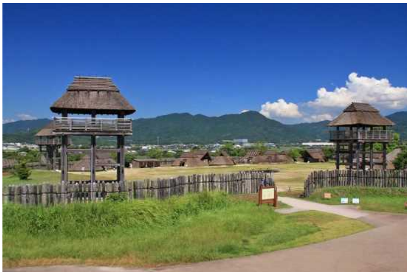
環濠集落ゾーン 南内郭