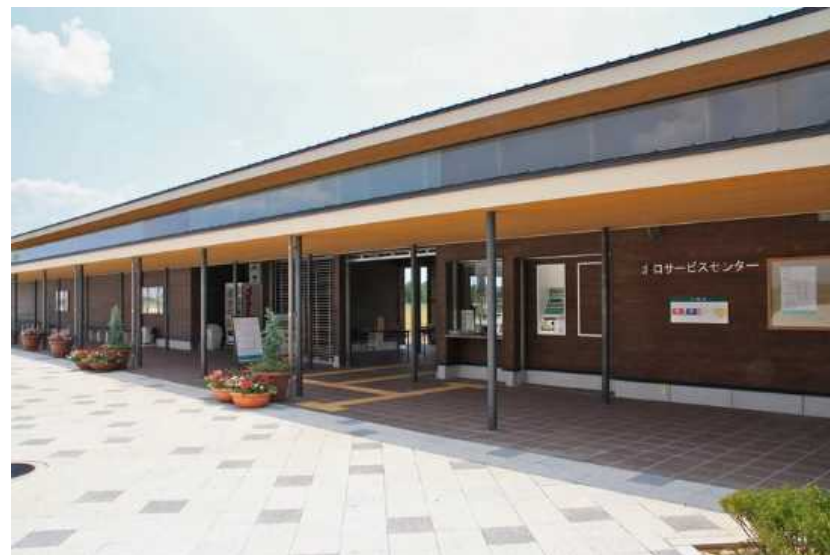
古代の森ゾーン 北口サービスセンター