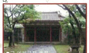
●구 엔카쿠질 홀문 슈리성 옆에 있는 쇼 왕가의 보다이절 F-6 류큐의 입재종의 총본산지. 쇼신왕이 부왕 쇼엔왕의 영령을 기리기 위해 1492년부터 3년에 걸쳐 건립하였으며 일본과 중국의 건축양식이 혼합되어 있습니다. 지난 오키나와전쟁시 파괴되었다가 1968년에 복원되었습니다. 슈리역에서 도보 10분. 나하시 슈리토노구라초

1501년에 쇼신왕이 세운 제2소씨왕릉 역대 왕가의 묘당. 석조 파종묘가 3기 면에서 서 있다. 슈리역에서 걸어서 15분 또는 150엔버스로 5분 슈리성에서 역까지150m 098-885-2861 9시~18시 (입장마감 17시30분 무휴) 할인포인트 어른/300엔~120엔 초·중생/150엔~50엔