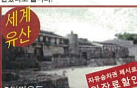
●다마우든 자유승차권 제1호 입장료할인

1501년에 쇼신왕이 세운 제2소씨왕릉 역대 왕가의 묘당. 석조 파종묘가 3기 면에서 서 있다. 슈리역에서 걸어서 15분 또는 150엔버스로 5분 슈리성에서 역까지150m 098-885-2861 9시~18시 (입장마감 17시30분 무휴) 할인포인트 어른/300엔~120엔 초·중생/150엔~50엔