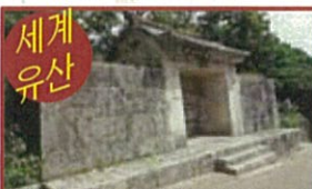
●쇼노칸우타키 석문 쇼신왕이 건립한 문으로 석문건너편은 성역, 국왕의 출어행차 동안에, 길에서의 안전을 기원했다고 합니다.