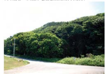
Ⓓ 字西の御願の植物群落 (県指定・天然記念物/昭和55年4月30日)