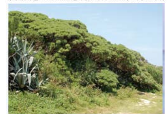
Ⓕ 照喜名原のモンバの木群落 (村指定・天然記念物/昭和59年9月14日)