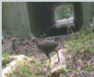
県道2号線のアンダーパス

本島北部のやんばるの地域は、亜熱帯の森林が広がり、ヤンバルクイナ等の多くの固有種が生息していますが、その稀少動物が路上へ出現し、交通事故にあっています。