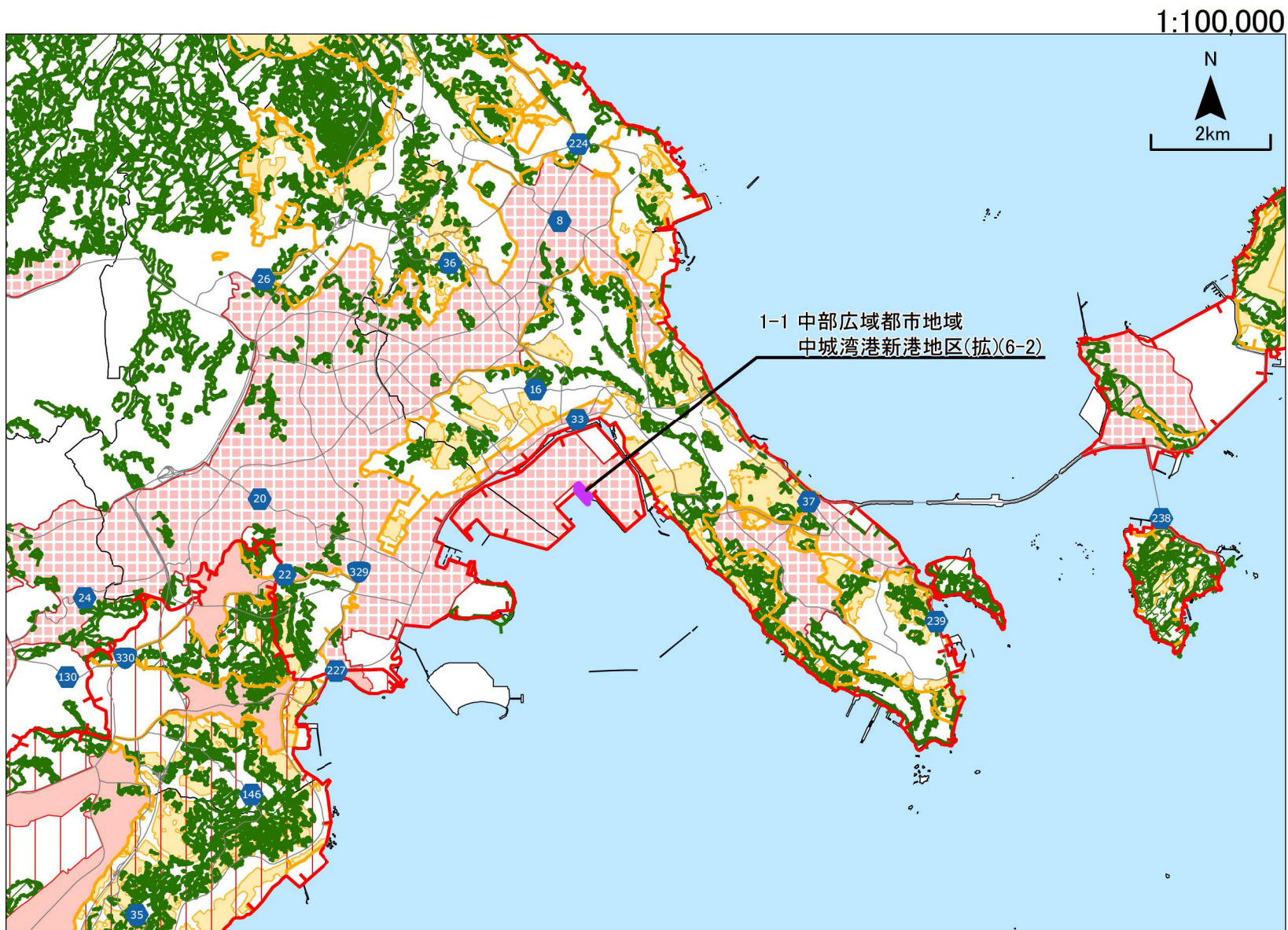
変更位置図1 中部広域都市地域(拡)