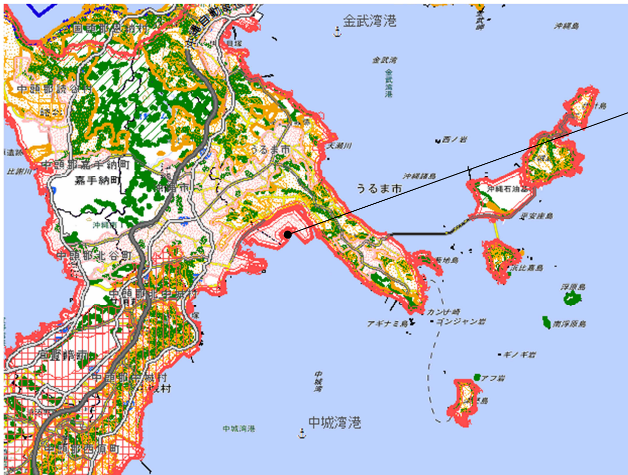
1-1 中部広域都市地域(拡)