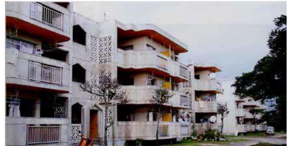
石垣市大浜1349-1(地図:外部サイトへリンク)