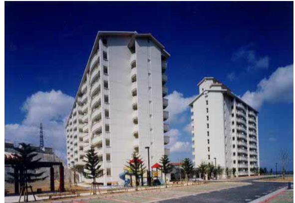
沖縄市八重島2-12-1(地図:外部サイトへリンク)