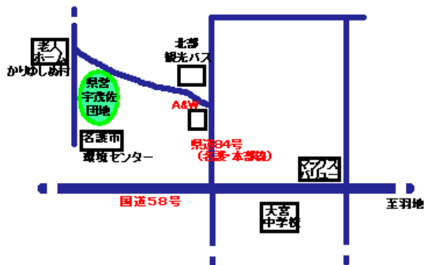
名護市宇茂佐1709-11(地図:外部サイトへリンク)