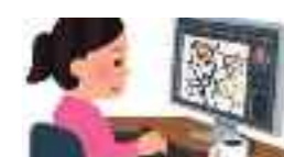
イラストレーター