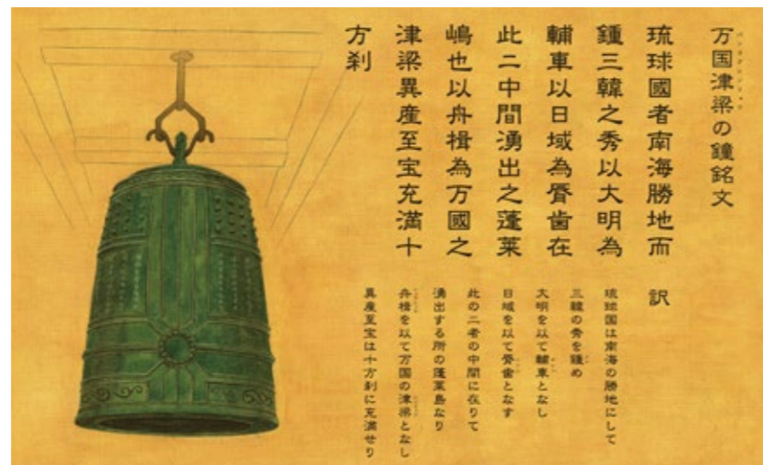
○万国津梁钟(铸造于15世纪,曾悬挂在首里城正殿)

现在冲绳县的舞台已经从海洋扩展到了天空，将充分运用地处东亚中心的地理优越性，不仅为冲绳，更希望为全日本和亚洲的发展作出贡献，朝着“21世纪的万国津梁”这一目标而努力奋斗。