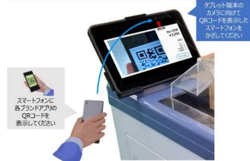
《QRコード決済のイメージ》