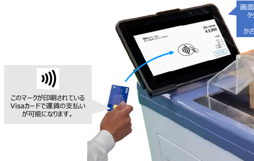
《Visa のタッチ決済のイメージ》

または、対応している QR コード(二次元コード)を読取機器にかざしていただくことで運賃をお支払いいただくこともできます。(バス事業者により対応している QR コードやご利用方法は異なります。)