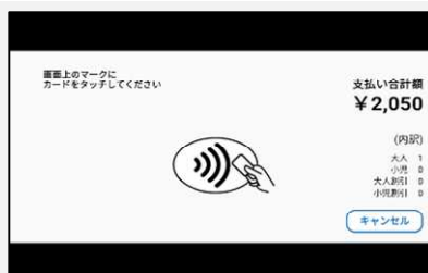
【Visaのタッチ決済の場合】

【QRコード決済の場合】 ・画面が表示されましたら、「読取位置」にQRコードをかざして完了です。