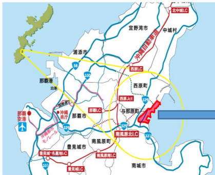
マリンタウン MICE エリア地区の位置