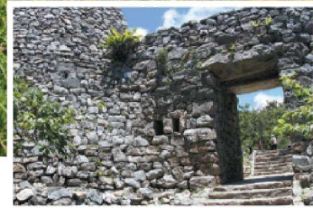
Heiro-mon Gate, the main gate of Nakijin Castle. There are observation windows (hollows) for viewing the exterior on both sides of the gate. 나키진성의 정문 '헤이로 문'. 양쪽에 외부의 땅을 보는데 사용된 창문(틈새)이 있습니다