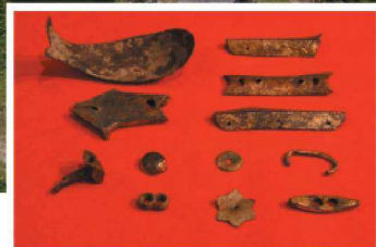
Many artifacts have been excavated, such as pottery, porcelain, coins and copperware from China, Southeast Asia and Yamato Province. 중국과 동남 아시아, 야마토의 도자기류와 옛날 동전, 동제품 등이 대량으로 출토되고 있습니다