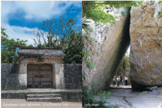
Sonohyan Utaki Ishimon 소노한우타키 석문 Sefa Utaki 세하우타키