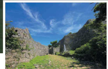
The front gate (main gate) faces southwest. Find Minami no Kuruwa (Suiutoshi) by entering the castle through the front gate. 남서쪽을 향해 세워진 정문. 정문을 통과하면 남쪽의 성곽(슈리 오베소)이 있습니다