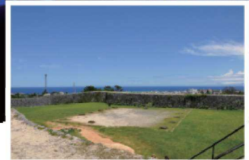
The remains feature the beauty of gusuku, which served as a fortress and offers a splendid view.