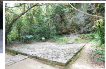
Oaraori used to be held at Ufugui. A place with the same name also exists within Shurijo Castle.

The most sacred place in the Ryukyu Kingdom, Sefa-Utaki, consists of multiple sacred areas (ibi) surrounded by rugged mountains and forests. Among the priestesses who presided over the rituals in the days of the Ryukyu Kingdom, the Kikoe Okimi was the most prominent. A new Kikoe Okimi was appointed after the Oaraori ceremony. Priestesses left Shuri to visit Sefa-Utaki, and prayed at ibi. The new Kikoe Okimi became official at the end of the ritual in which the gods gave the spiritual power called seji to the new Kikoe Okimi.