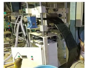
引取装置を使用した連続成形