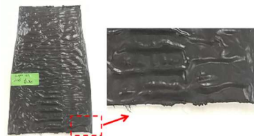
成形実験状況（表面形状検討）