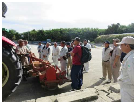
農業機械士安全・整備講習会(波照間島)