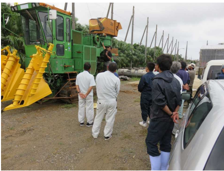
オペレーター養成研修(石垣市)

八重山支部では農作業安全対策を推進するため、今年度も技能向上研修、農作業安全講習会などを予定しています。 (担当:宮里)