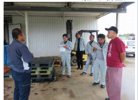
先進地視察研修(宮古島市)