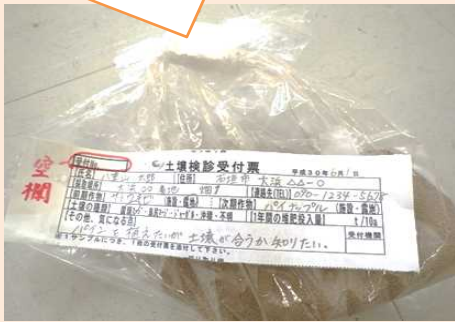
品目ごとの分析項目▽

土壌サンプルは、乾燥させてざるやふるいに掛け、細かい状態にして土壌検診受付票とともに提出お願いします。 受付票は普及課にもありますよ。