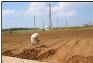
埋まった植え溝の芽掘り