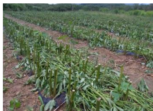
オクラの切り戻し