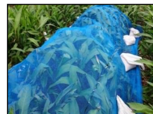
ヘリコニアのべた掛け