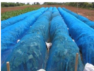
オクラ・ネットのべた掛け