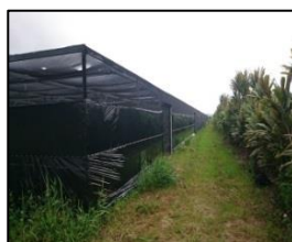
平張り施設:側面二重ネット