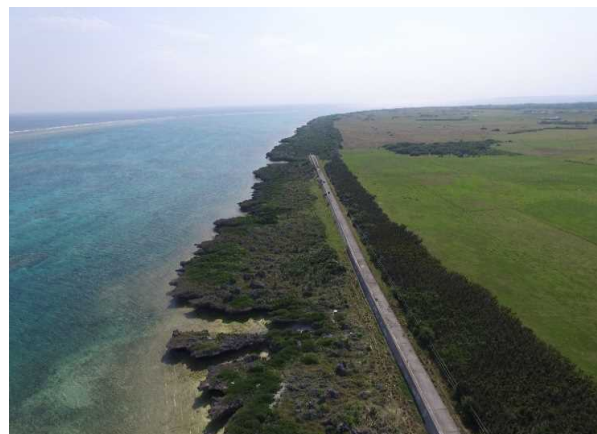
潮害防備保安林(竹富町黒島)