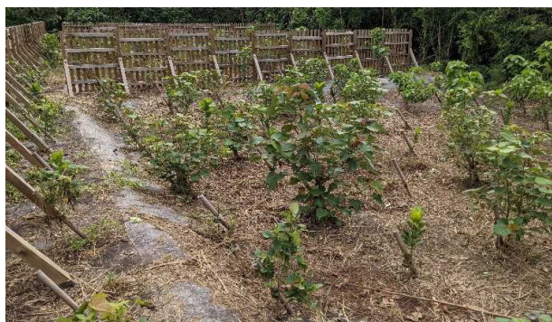
海岸防災林造成(R2真栄里)