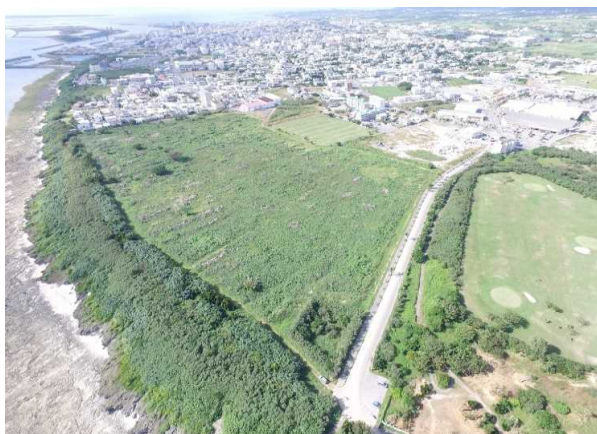
潮害防備保安林(石垣市真栄里)