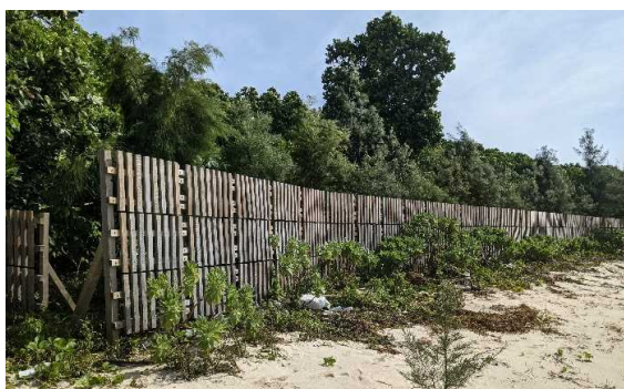
海岸防災林造成(H30伊原間)