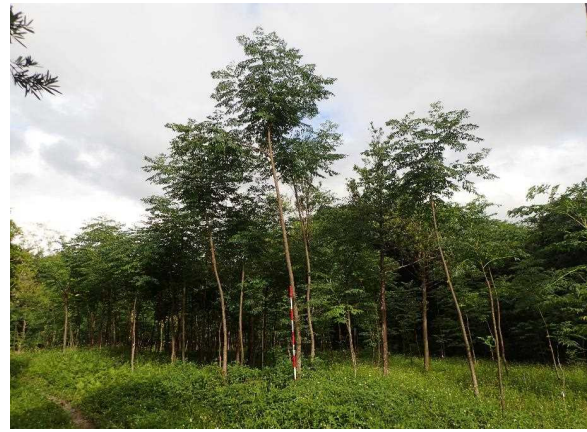
人工造林(センダン)