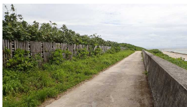
保安林緊急改良(H30白保)