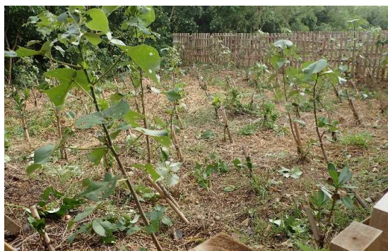
海岸防災林造成(R1真栄里)