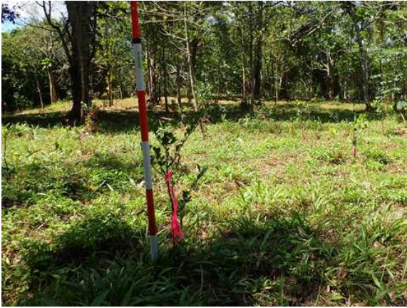
樹下植栽（上層:イヌマキ、下層 リュウキュウコクタン）