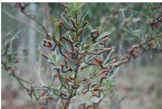
キオビエダシャク(平得大俣県営林)