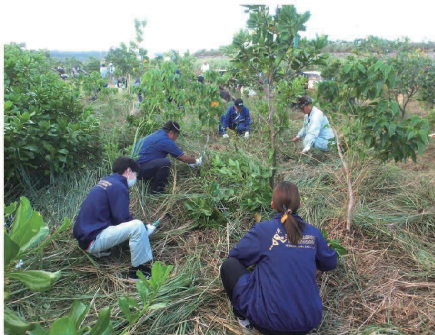
美ぎ島宮古グリーンネット(下刈り、植栽、育林活動)