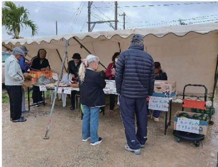
保良自治会(日曜市の開催、拝所周りの清掃・美化活動)