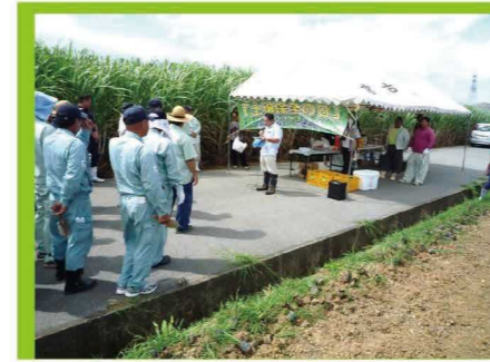
土壌保全の日 開会式の様子①

毎年6月の第1水曜日を土壌保全の日とし、土壌の流出による地力の低下を未然に防ぐことを目的に、土壌保全の必要性について意識の改善と啓発を目的として1990年から施行されました。宮古地域では、グリーンベルトの植栽活動を通して、土壌流出防止と農地の景観形成を目指し、リュウノヒゲやアキノワスレグサ等の植栽活動を行っています。