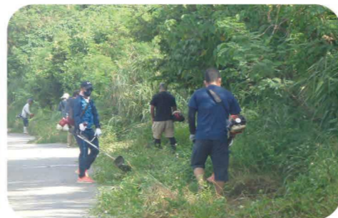
農道路肩の草刈り