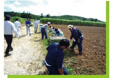
土壌保全の日 植栽の様子②