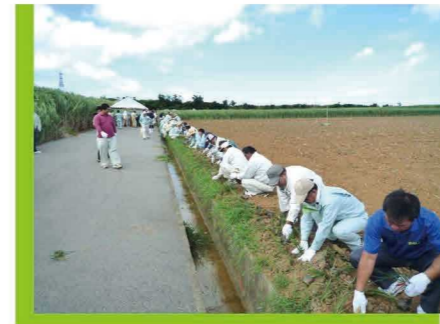
土壌保全の日 植栽の様子①