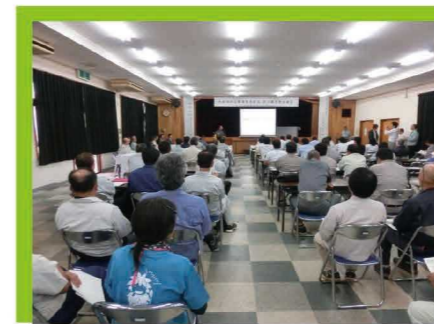
防風林の日 講演会

台風をはじめとした自然災害から農作物、農地を守る防風林・防潮林の普及啓発のため毎年11月の第4木曜日を「防風林の日」として定めています。防風林の日には、防風林として植樹された樹木の手入れや防風林の成長を妨げる下草の刈り取りが行われています。