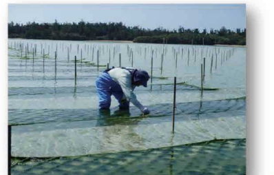
大浦湾のアーサ養殖