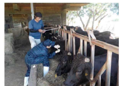
アカバネ病予防注射