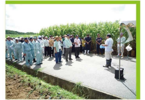
土壌保全の日 開会式の様子②