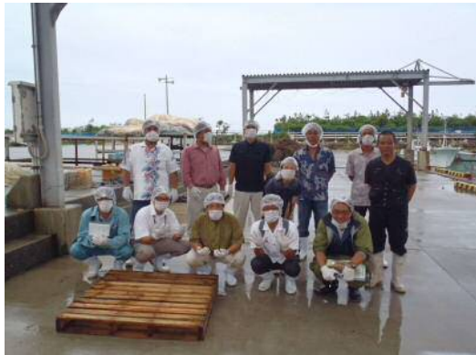
モズク加工先進地視察