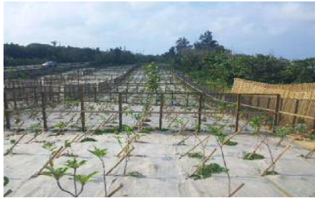
海岸防災林造成事業①