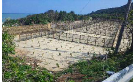
海岸防災林造成事業②