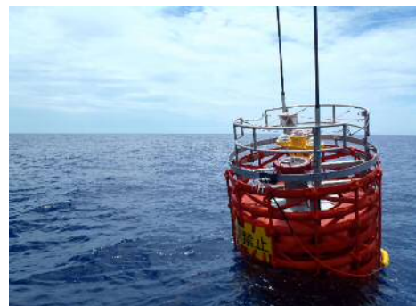
沖縄県が設置しているパヤオ「海宝」