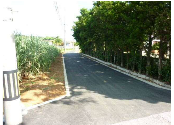
農業集落道整備 (吉田)