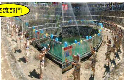
宮国民俗芸能保存会