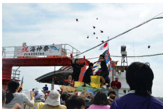
航海安全・豊漁を祈願する海神祭