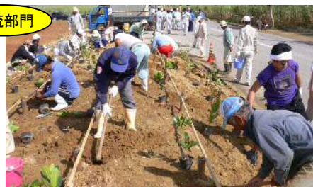
美ぎ島宮古グリーンネット