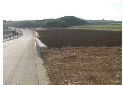
区画整理後のほ場