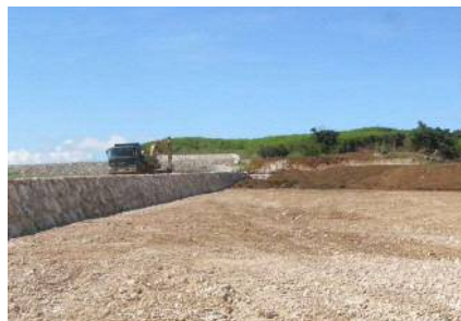
区画整理工事の様子