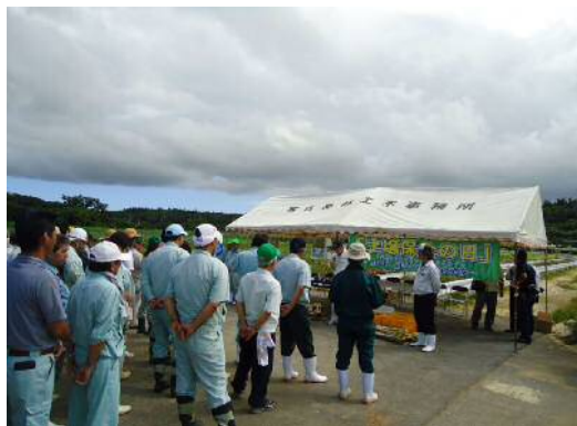
土壌保全の日 開会式の様子

毎年6月の第1水曜日を土壌保全の日とし、土壌の流出による地力の低下を未然に防ぐことを目的に、土壌保全の必要性について意識の改善と啓発を目的として1990年から施行されました。宮古地域では、グリーンベルトの植栽活動を通して、土壌流出防止と農地の景観形成を目指し、リュウノヒゲやアキノワスレグサ等の植栽活動を行っています。