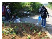
景観形成(花苗植栽)