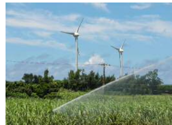
畑かん施設整備後(スプリンクラー)