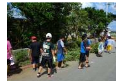
景観形成(空缶拾い)