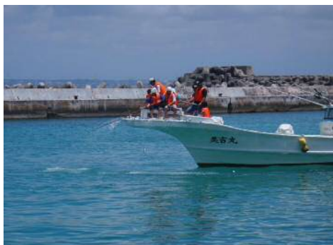
パヤオの日に行われたカツオー一本釣り体験

パヤオの日には、水産関係者を一堂に集め式典を開くとともに、パヤオ祭を開催して、水産物の販売を行っている。また、パヤオで操業している漁船の体験乗船や種苗放流など、後継者育成もかねて行っている。