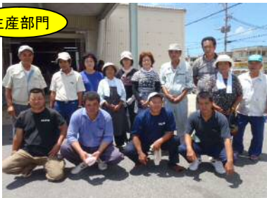
沖縄県たばこ耕作組合下地第2総代区