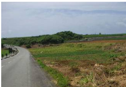
区画整理前のほ場