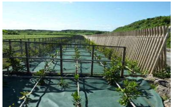
農地保全整備事業 (防風施設)