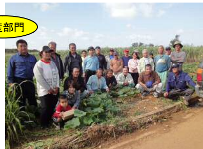
JAおきなわ宮古地区かぼちゃ専門部会伊良部支部