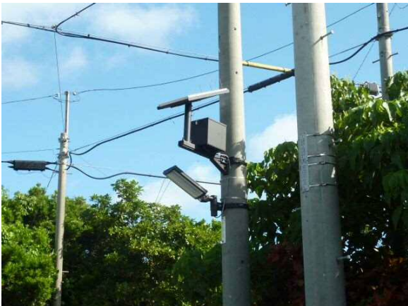
防災施設整備ソーラー照明(西東・吉田・仲原・久松)