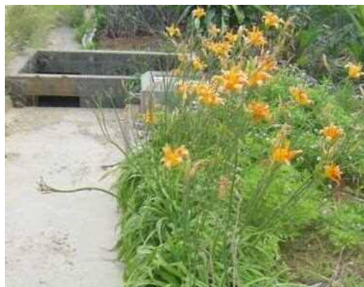
アキノワスレグサ