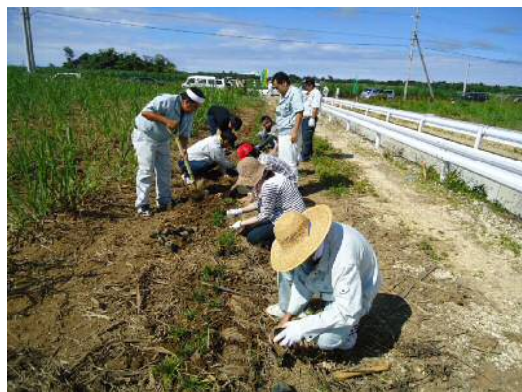
土壌保全の日 リュウノヒゲの植栽活動