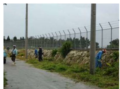
農道・防風林帯等の維持・管理作業