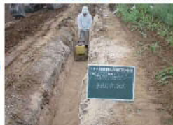
②管基礎材均し転圧