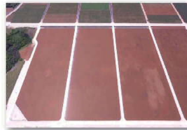
区画整理後のは場②