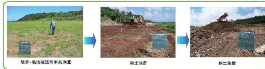
境界・現地確認等事前測量