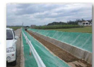
水利用調整・高度化支援事業による改修前の法面保護