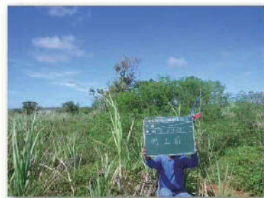
区画整理前のは場①