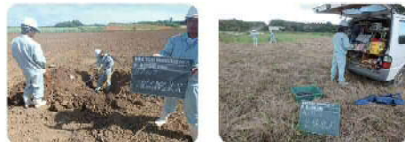
不発弾探査の様子