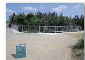
農業水利施設保全合理化事業による改修後のフェンス