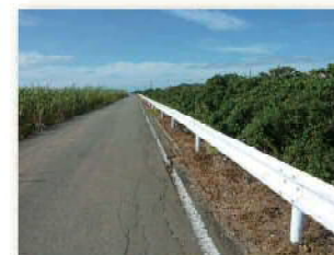
水利用調整・高度化支援事業による改修後の法面保護