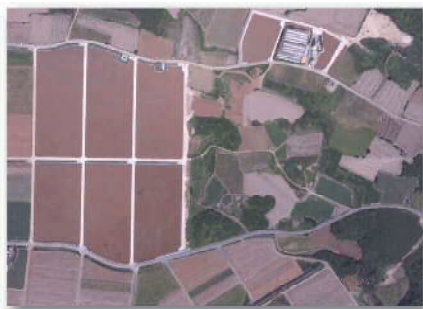
区画整理による整備箇所と未整備箇所の比較