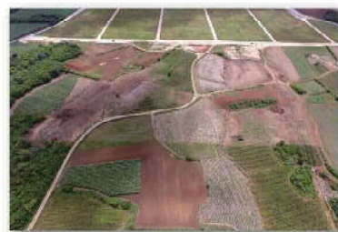
区画整理前のは場②