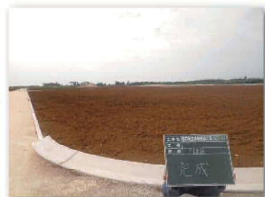
区画整理後のは場①