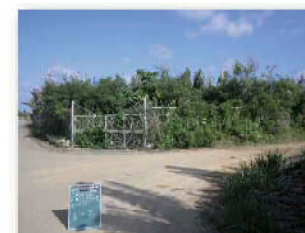
農業水利施設保全合理化事業による改修前のフェンス