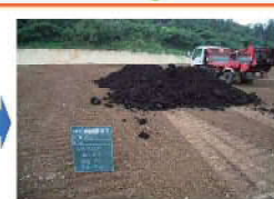
ほ場整備:有機質肥料散布