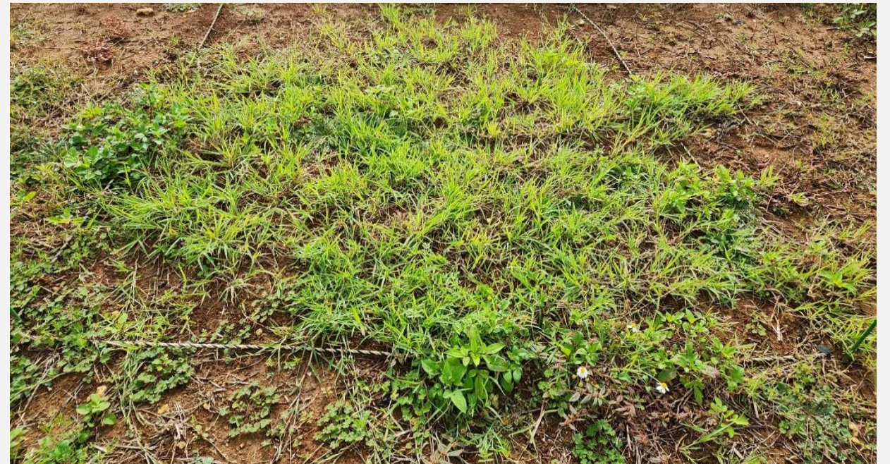
(B) 除草剤散布 + 耕起処理