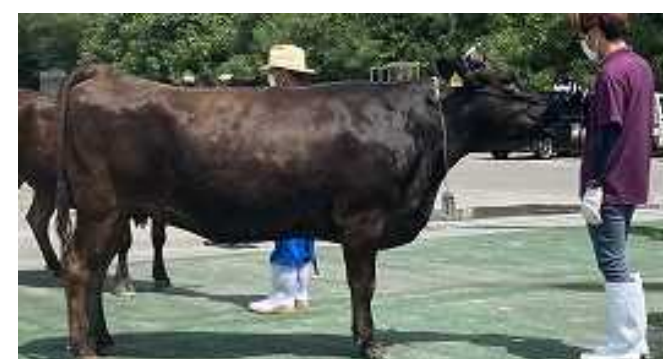
娘：のぞみ号は、 母譲りの体積感を持ちながら 【資質】が改善されています。