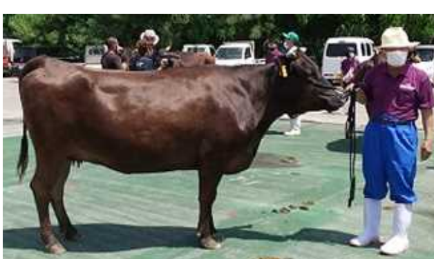
母：はるな号の【体積感】