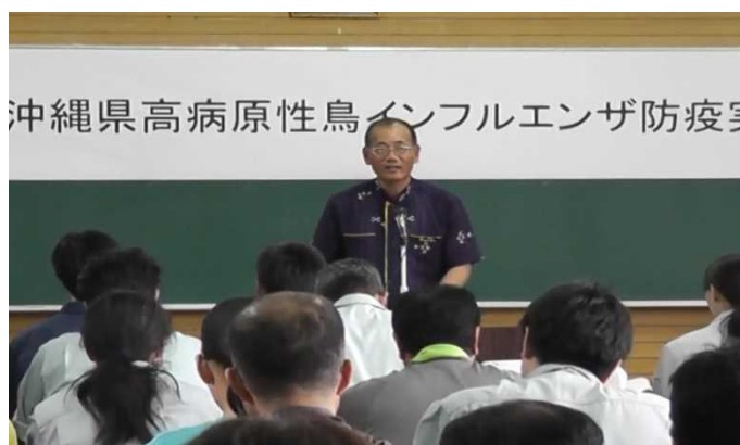
島尻勝広農林水産部長の主催者挨拶