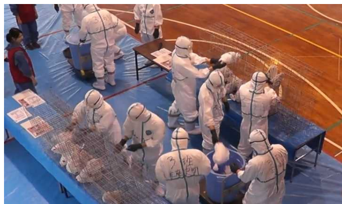
模擬鶏の捕鳥訓練