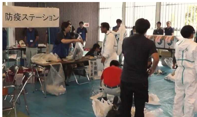
防疫ステーションの運営