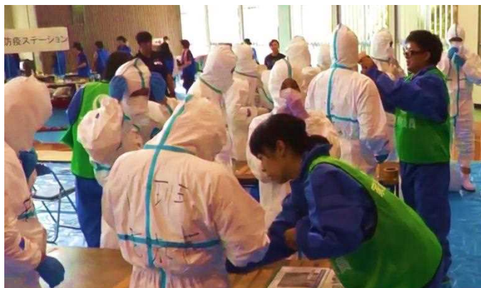
防護服の着衣指導