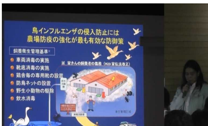
鳥インフルエンザについての講義