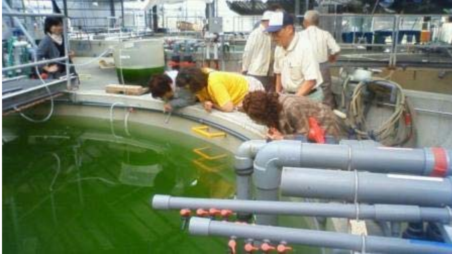
ヤイトハタの種苗生産水槽で。 ふ化後4日目のミーバイの赤ちゃんです。 「見えない……???. アツ、いた!いた!」