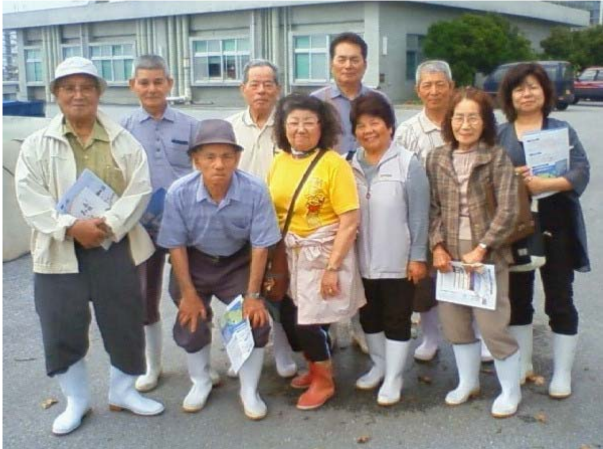
みんなで記念撮影。