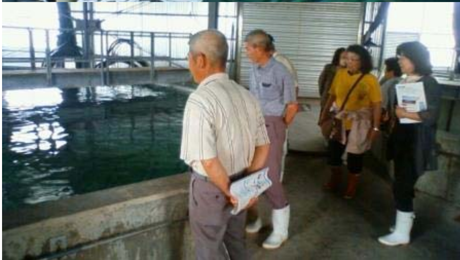
親魚水槽で。 写真左:ハマフエフキの親魚水槽、写真右:ヤイトハタ親魚水槽 ハマフエフキやヤイトハタが20年以上も生きるという話に感心。