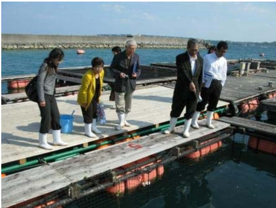
世界最大のハタの一種、タマカイの生簀で。 この生簀のタマカイは最大50kgですが、 文献では最大400kgに達するとされています。