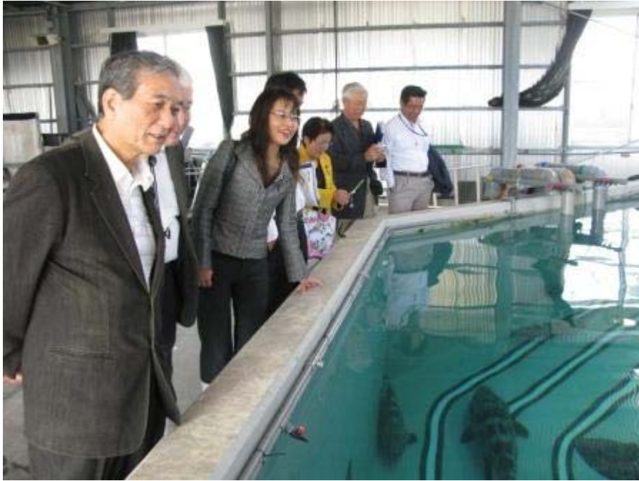
ヤイトハタ親魚水槽で。 その大きさに驚いておられました。