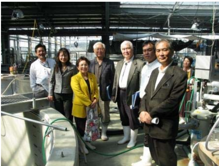
S型ワムシの培養水槽で。皆さんそろって撮影。 ピーカーの中 の 小さなワムシ(0.2mmほど)を肉眼で観察して頂きました。