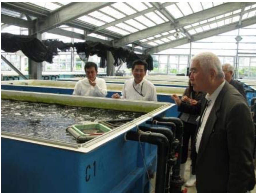
シラヒゲウニの餌のオゴノリの培養水槽(右)で。 培養中のオゴノリをちょっと試食。