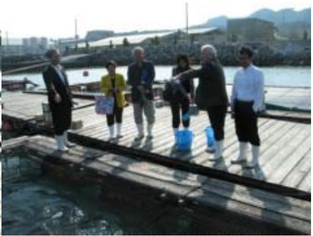
マダイ一歳魚の生簀で給餌体験。 餌に集まる魚に歓声が！