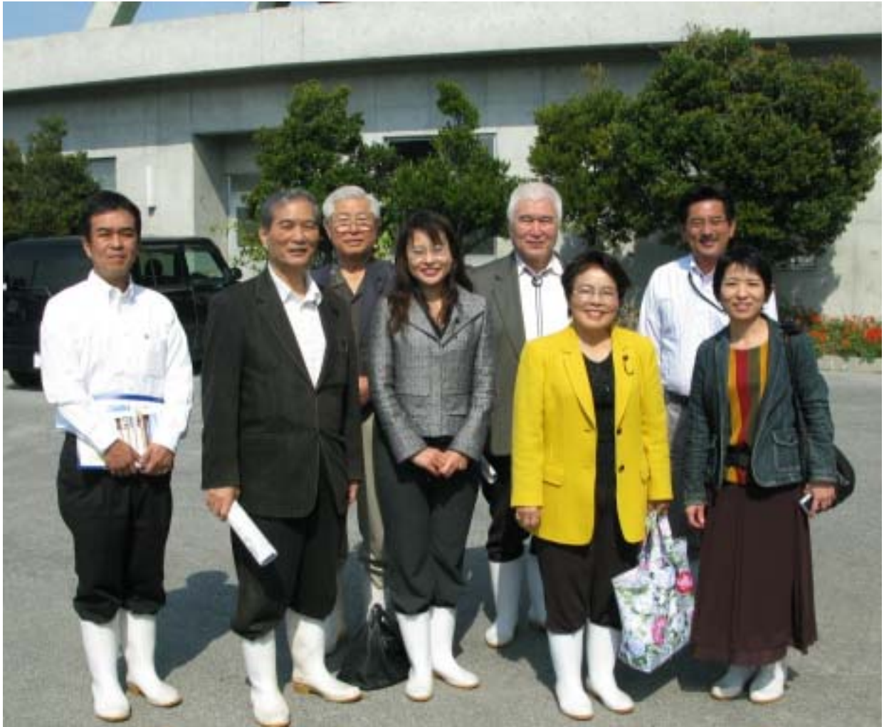
来所視察記念の集合撮影。 「ハイ、キムチ！」でニッコリ。