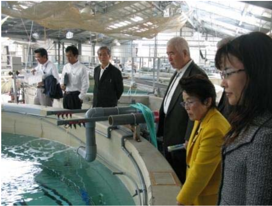
ハマフエフキ(タマン)の親魚水槽で。 来月から卵を産ませて、種苗生産を開始します。