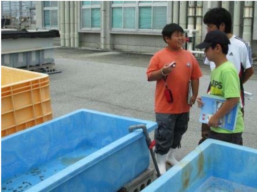
ヒメジャコの稚貝(ふ化後1年ほど)の綺麗な外套膜に感動?? 3月に埋め込み放流した稚貝と同じ年ですよ。