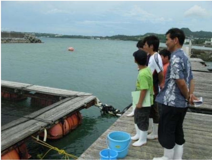
海面生簀で餌に集まるマダイの稚魚に「わア～、すごい！」 当センターの見学者に一番人気のある「給餌ショー」でした。