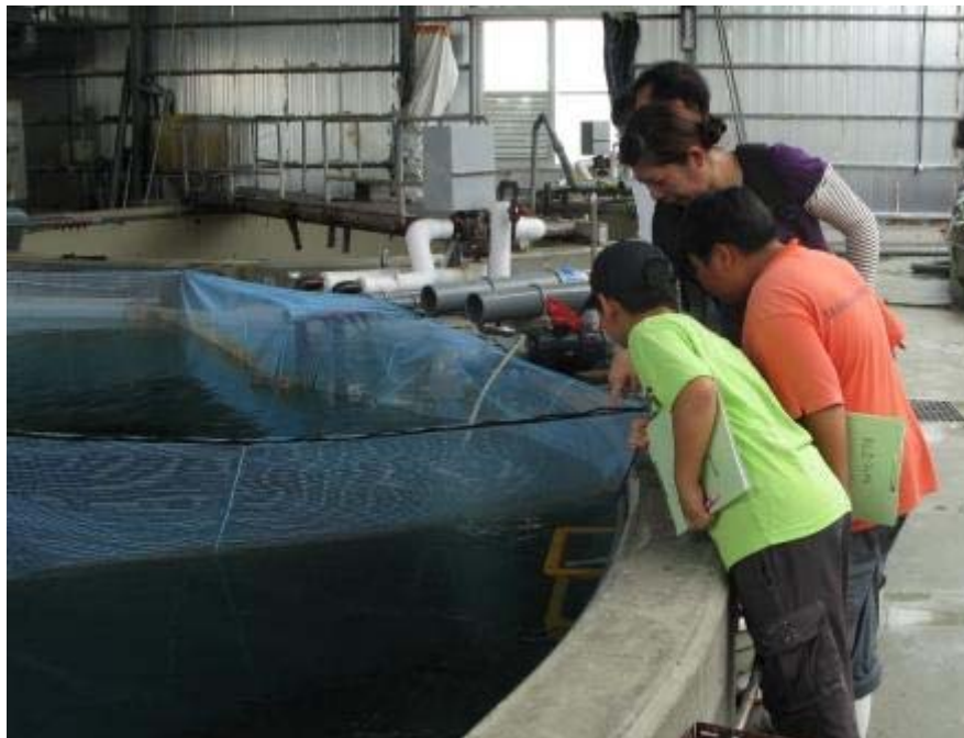
中間育成中のヤイトハタの稚魚を観察