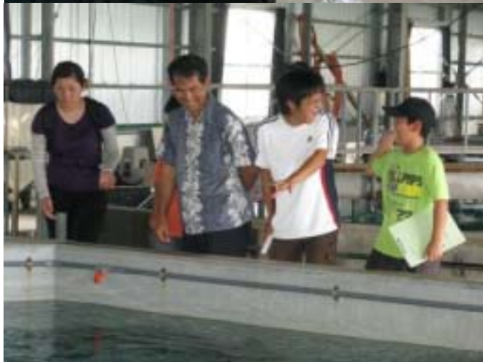
ヤイトハタ&チャイロマルハタの親魚水槽で。