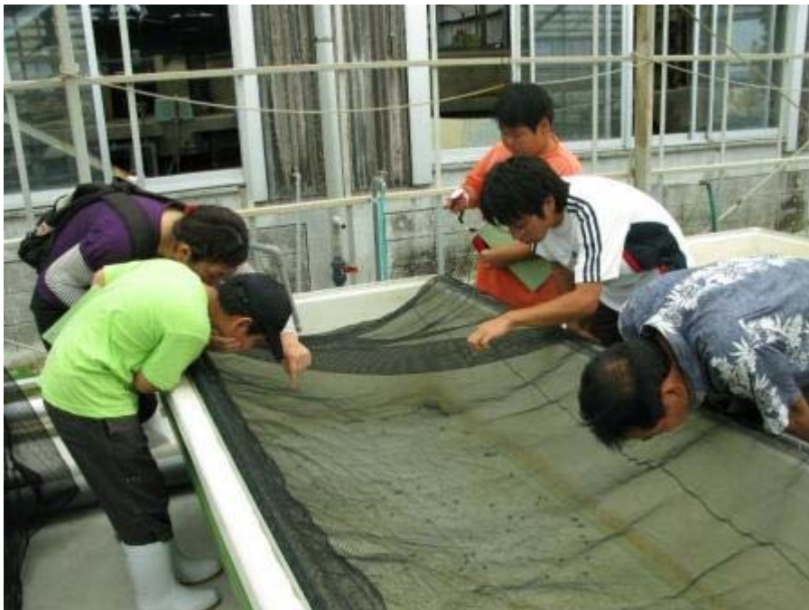
ふ化後2ヶ月足らずのヒメジャコの赤ちゃんに、 「あ、いるいる…、小さい!!」 皆さん、感動!?