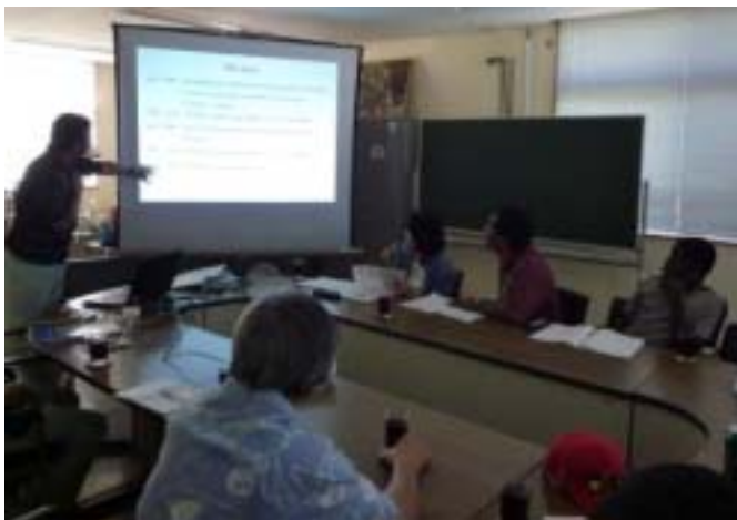
当センターの概要を説明中