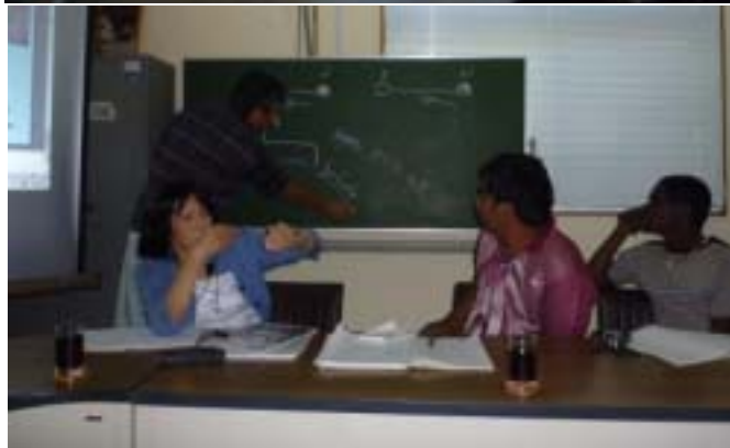
熱心に質問する研修生