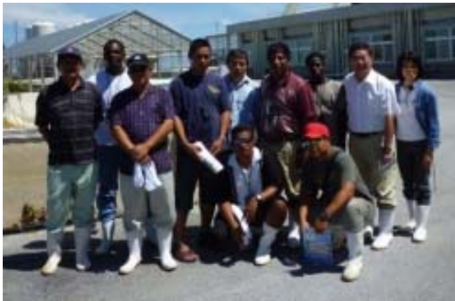
海外研修生と引率の皆さん