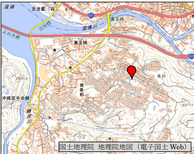
国土地理院 地理院地図 (電子国土 Web)