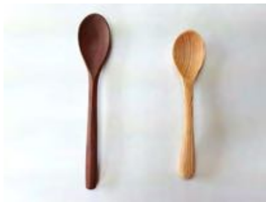
デザートスプーン こどもスプーン