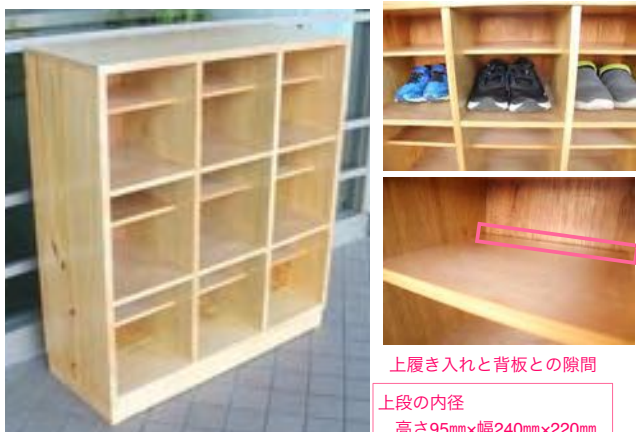
上履き入れと背板との隙間

上段の内径 高さ95mm×幅240mm×220mm 下段の内径 高さ145mm×幅240mm×295mm