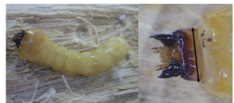
図2 カミキリムシの幼虫(図左)とその測定部位(図右中の矢印)