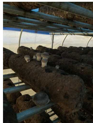
(上：中国で生産した菌棒でのしいたけ生産)