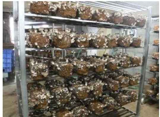
(上：県産菌床でのしいたけ生産)