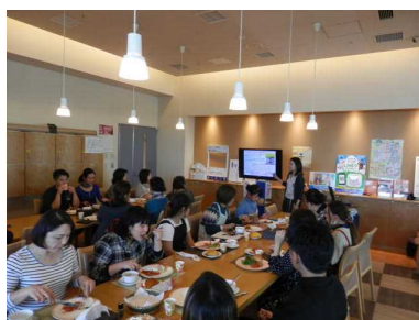
(県産きのこ普及講座)