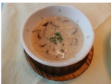
(きのこたっくさんクリームスープ)