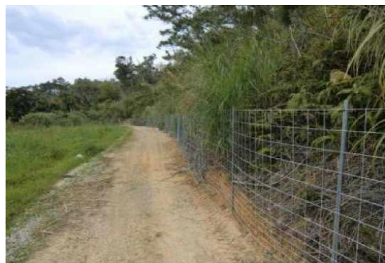
イノシシ侵入防止柵