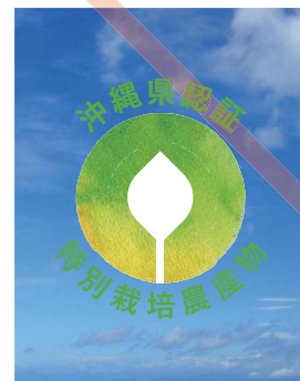
写真や複雑な背景上に表示する