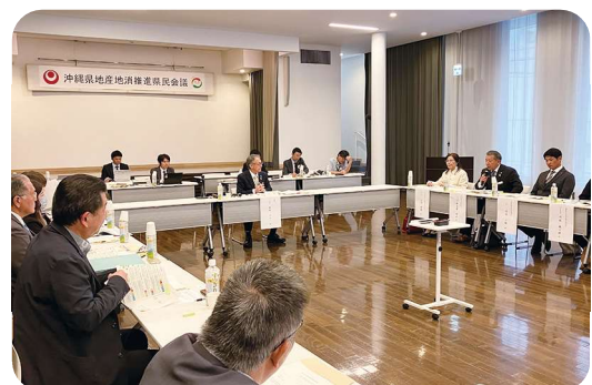
▲沖縄県地産地消推進県民会議の開催