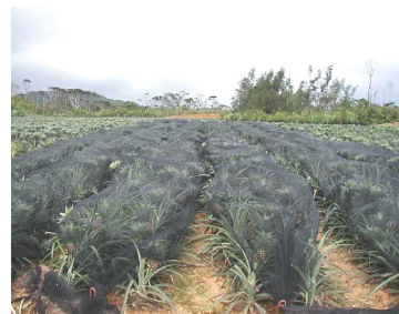
日焼け防止ネット