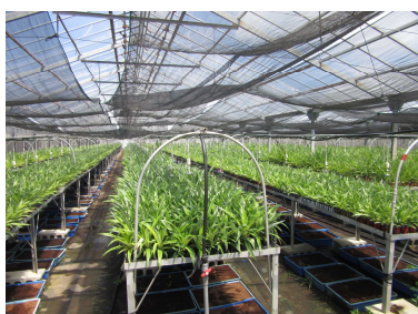
品質向上生産施設(種苗増殖施設)