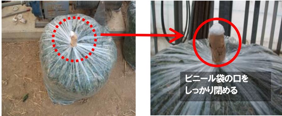
図7 ビニール袋による残さ物の密閉の仕方