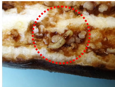
図2 ナスミバエ幼虫