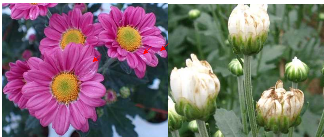
図3 花のかすり症状の被害(左から、小ギク(矢印)、輪ギク)