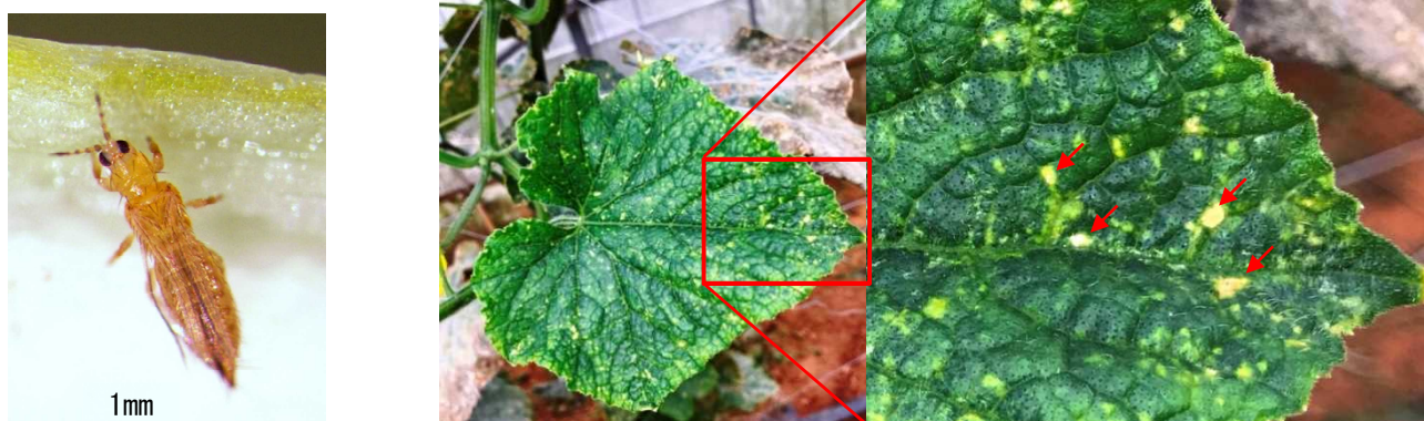
図1 ミカンキロアザミウマ 図2 キュウリの葉の白斑状の被害(矢印)