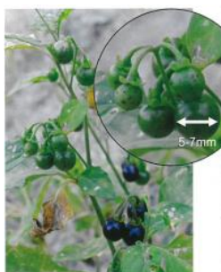
図4 テリミノイヌホオズキ