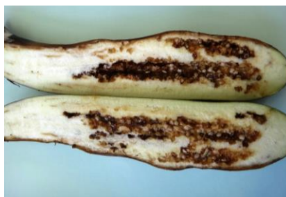
図5 ナス果実の内部腐敗