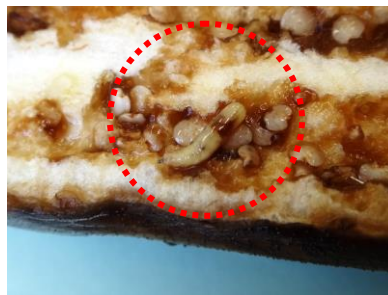
図2 ナスミバエ幼虫