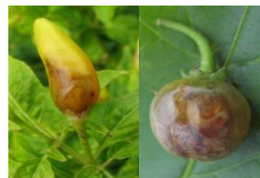
図6 シマトウガラシ(左)とテリミノイヌホオズキ(右)の被害