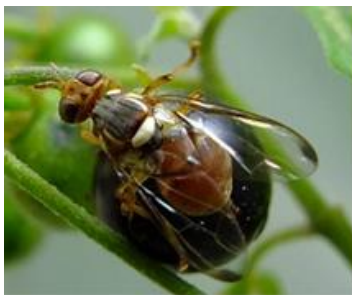
図1 ナスミバエ成虫

シマトウガラシやテリミノイヌホオズキ、家庭菜園のナス科植物の果実被害が顕著である。幼虫が寄生した果実は腐敗する(図5)。シマトウガラシやテリミノイヌホオズキでは果実が水浸状となる(図6)。