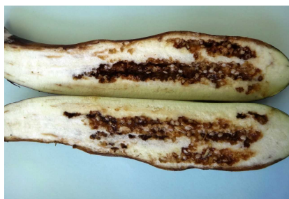
図6 ナス果実の内部腐敗