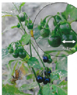
図5 テリミノイヌホオズキ