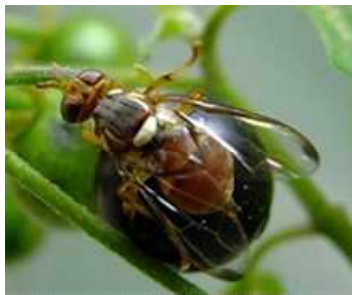
図2 ナスミバエ成虫

シマトウガラシやテリミノイヌホオズキ、家庭菜園のナス科植物の果実被害が顕著である。幼虫が寄生した果実は腐敗する(図6)。シマトウガラシやテリミノイヌホオズキでは果実が水浸状となる(図7)。