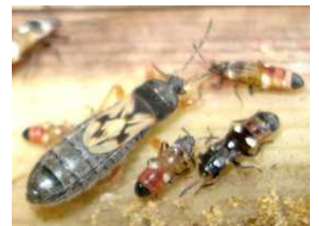
図.カンシャコバネナガカメムシの短翅型成虫と幼虫